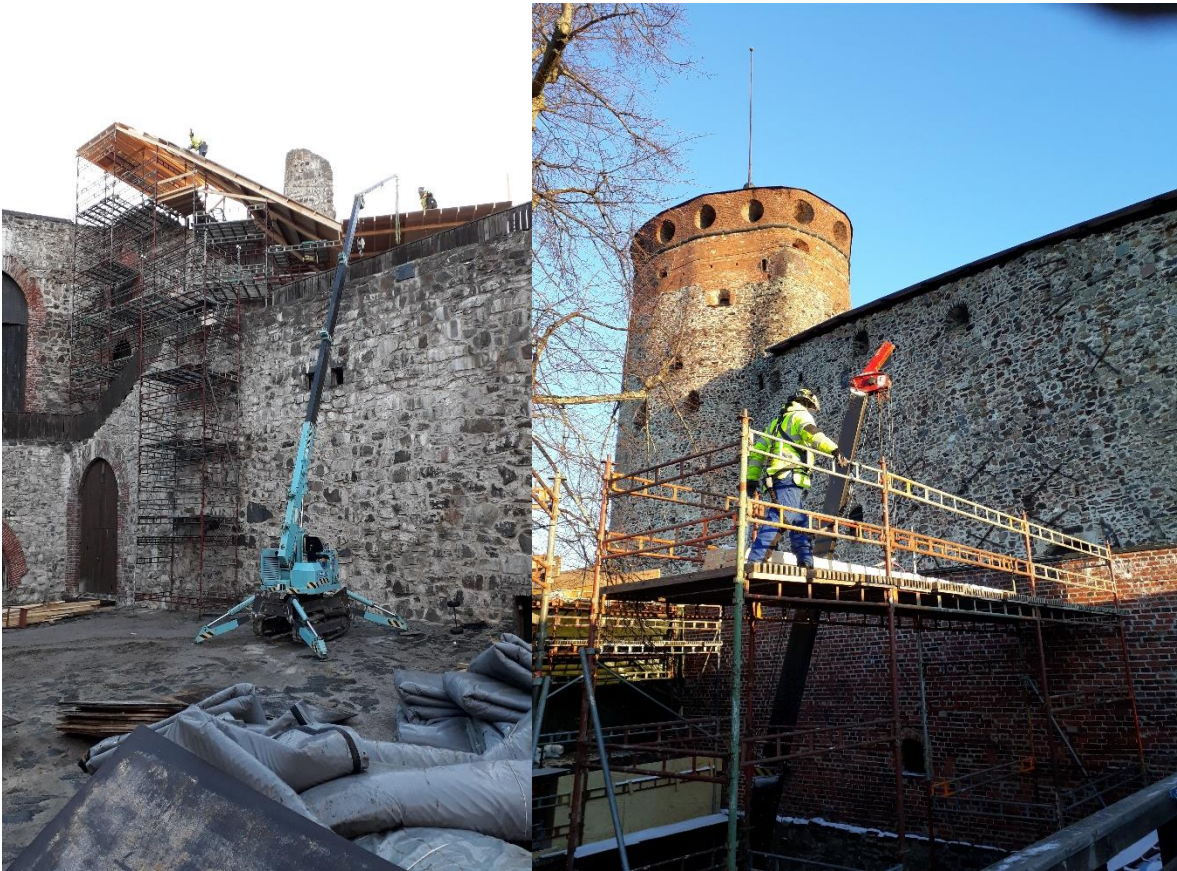
Kuva 4 Kuvassa Olavinlinnan rakennustyömaa muurien sisä- ja ulkopuolelta.