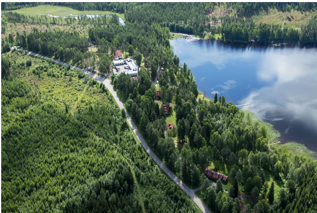
Изображение 1 Аэрофотоснимки территории и схема с указанием периметра и зон учреждения УИС «Сулкава»