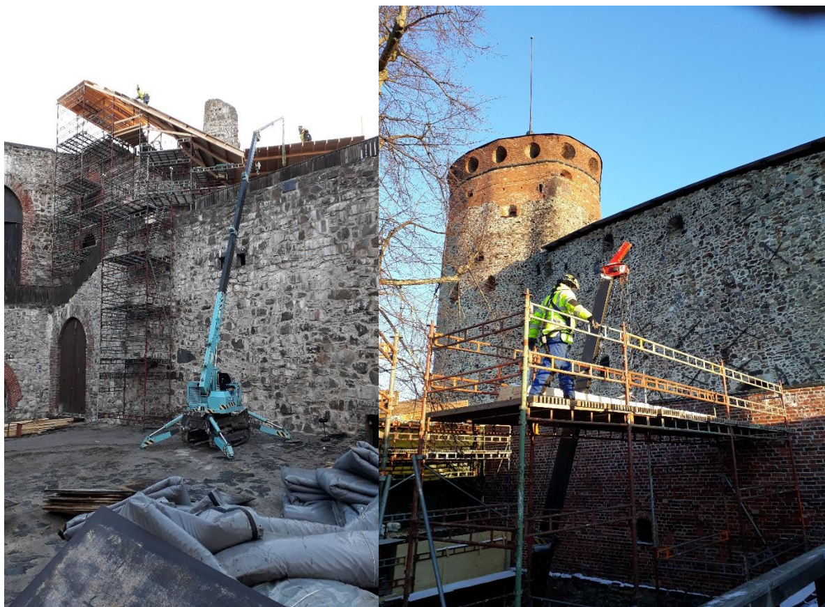
Изображение 4 Показана рабочая площадка в крепости Олавинлинна по обе стороны стен.

Почтовый адрес учреждения УИС «Сулкава»: