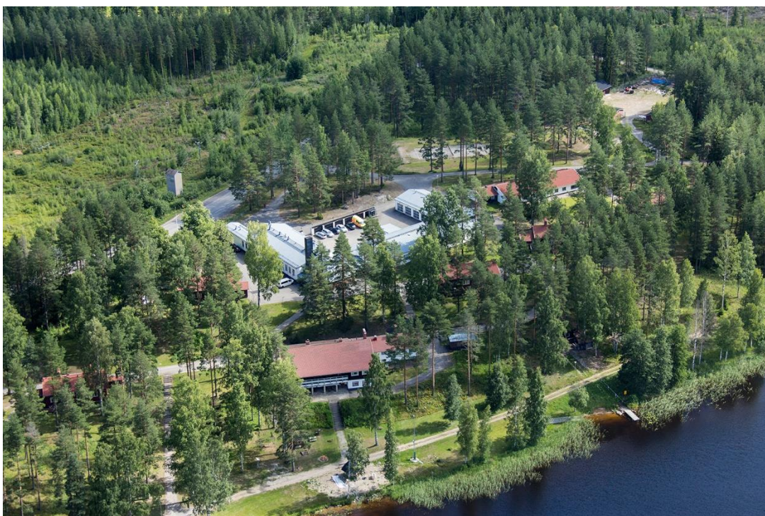
Изображение 2 Аэрофотоснимок учреждения уголовно-исполнительной системы «Сулкава». Вид с озера.