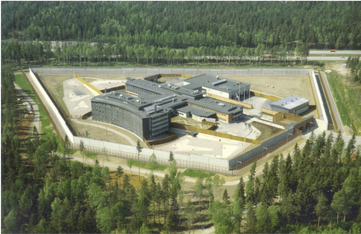
KUVA 1. Vantaan vankila

Olet saapunut Vantaan vankilaan. Vantaan vankila on vuonna 2002 toimintansa aloittanut vankila, jonka perustehtävänä on tutkintavankeuden toimeenpano ja vankikuljetus. Tutkintavankeuden tarkoituksena on turvata rikoksen esitutkinta, tuomioistuinkäsittely ja rangaistuksen täytäntöönpano sekä estää rikollisen toiminnan jatkaminen.