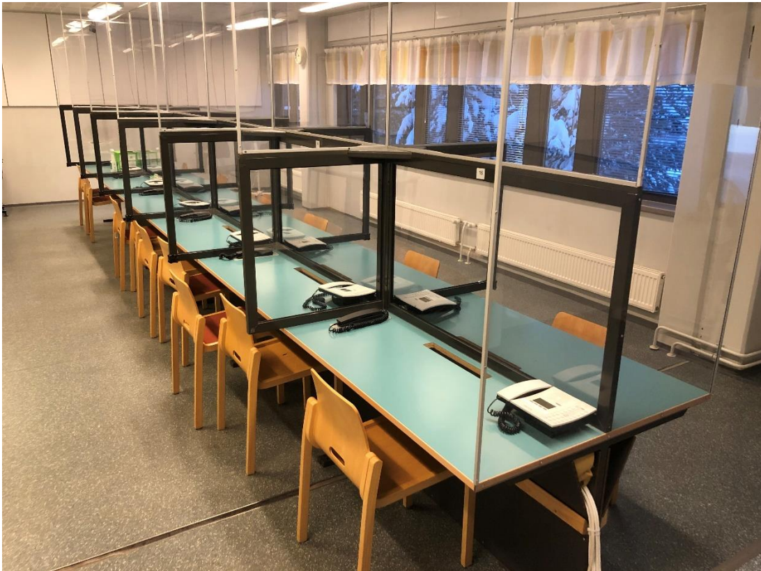
KUVA 5. Iso tapaamistila

tapaamisajankohtaa. Palauta lomake postilaatikkoon keskiviikkona klo 8.00 mennessä. Kirjevirtijan käsiteltävä lomakkeen, se palautetaan sinulle. Lomakkeeseen on merkitty myönnetty tapaamisaika ja hyväksytyt vierailijat. Ilmoita tapaamisaika vierailijoillesi. Sinulla on oikeus yhteen tapaamiseen tapaamispäivän aikana. Tapaamiseen voivat tulla puoliso ja samaan perheeseen kuuluvat lapset tai enintään yksi muu tapaaja. Valvotuissa tapaamisissa on ehdoton koskettamiskielto eikä tapaamisissa saa luovuttaa eikä ottaa vastaan mitään. Tapaaminen tapahtuu tilassa, jossa on useita tapaajia ja vankeja kerrallaan. Tapaajan ja vangin välissä on plexi-lasi. Keskustelu tapahtuu puhelimen välityksellä.