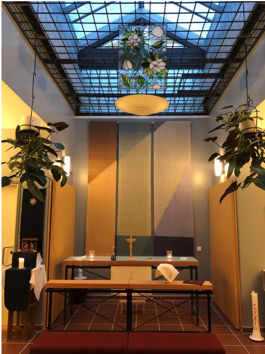
KUVA 11. Vankilan kappeli