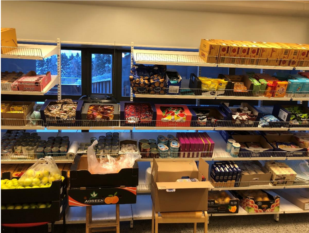
KUVA 4. Laitosmyymälä