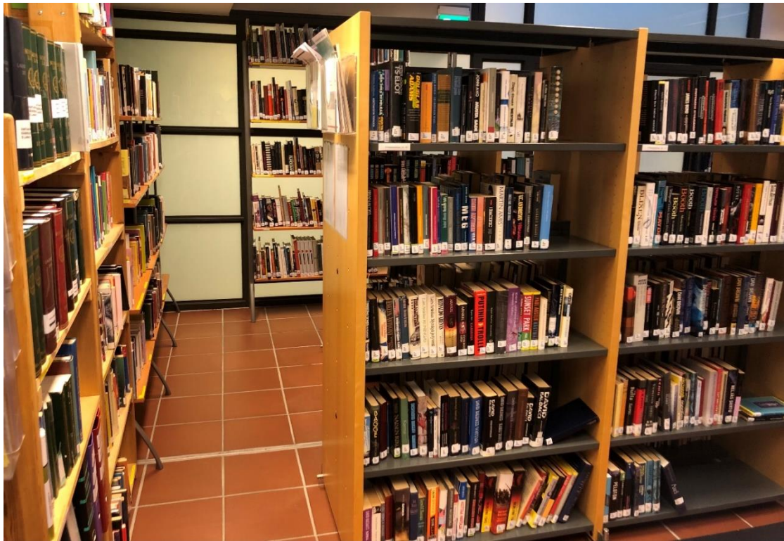
KUVA 10. Vankilan kirjasto

Vantaan vankilassa toimii kirjasto, josta voit lainata kirjoja ja lehtiä. Kirjastossa käydään osaston päiväjärjestyksen mukaisesti. Lisäksi osastoilla on pieniä kirjakokoelmia, jotka ovat vapaasti käytettävissä. Vankilalla käy myös kirjastoauto, joten mikäli haluat hyödyntää yleisten kirjastojen palveluita (esimerkiksi kaukolainaa) ota yhteyttä kirjastonhoitajaan. Muista palauttaa lainaamasi kirjat laina-ajan päätyttyä, siirtyessäsi toiseen laitokseen tai vapautuessasi.