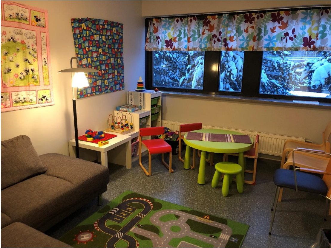
KUVA 6. Lapsitapaamistila