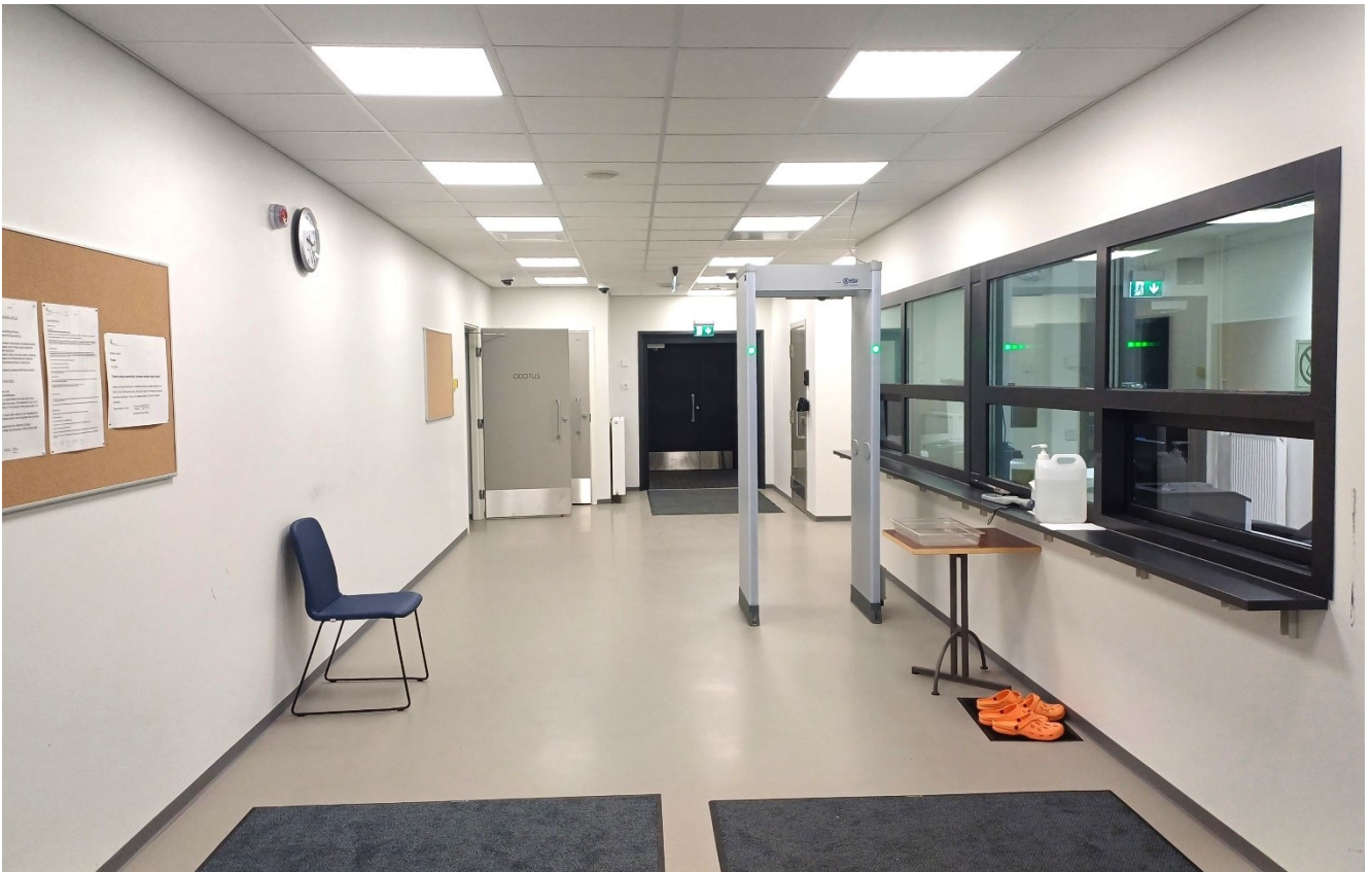
KUVA 3. Porttirakennus

Vankilaan ei voi tulla päihteiden vaikutuksen alaisena!