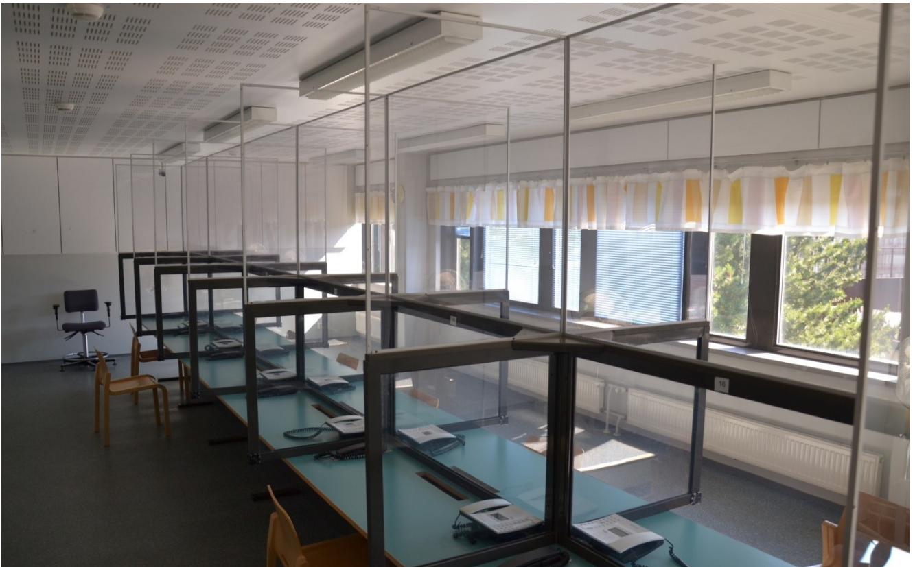
KUVA 4. Valvottu tapaamistila

Alaikäisen tapaaja voi tulla vankilaan tapaamaan muita kuin omaa vanhempaansa vain huoltajansa kirjallisella luvalla. 15 vuotta täyttänyt tapaaja voi tavata lähiomaistaan ilman huoltajan suostumusta, jos huoltaja ei ole nimenomaisesti ilmoittanut vastustavansa tapaamista. Jos alaikäinen tapaaja on otettu huostaan, luvan tapaamiselle antaa lastensuojeluviranomainen. Alle 15-vuotiasta tapaajaa ei yleensä päästetä vankilaan ilman saattajaa.