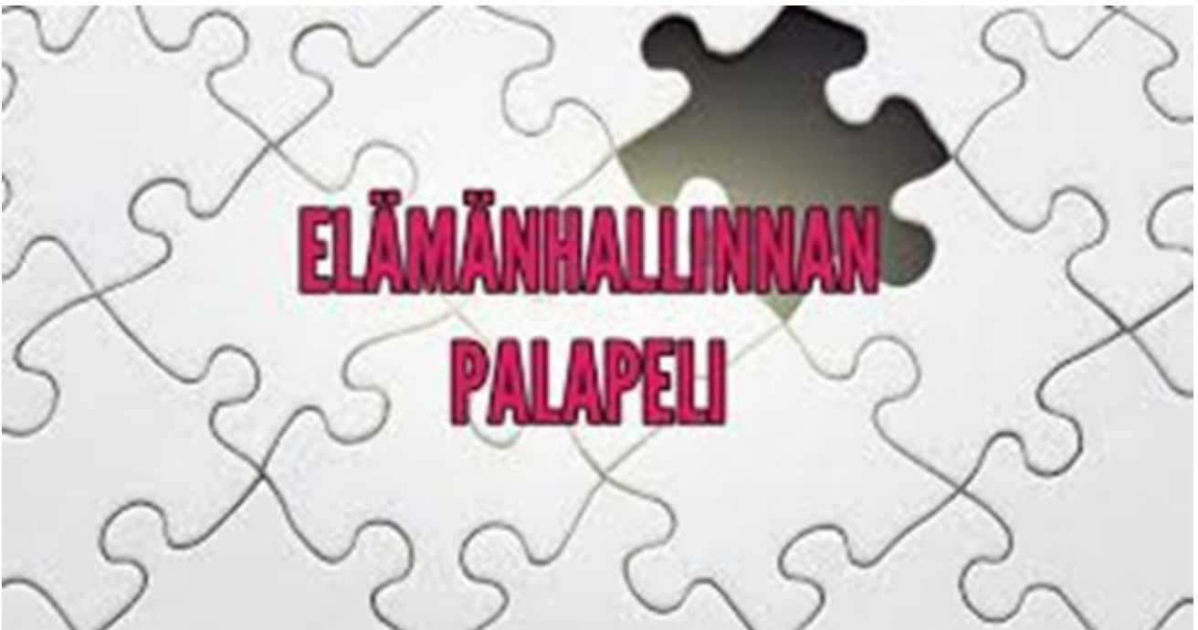
KUVA 10 Elämänhallinnan palapeli