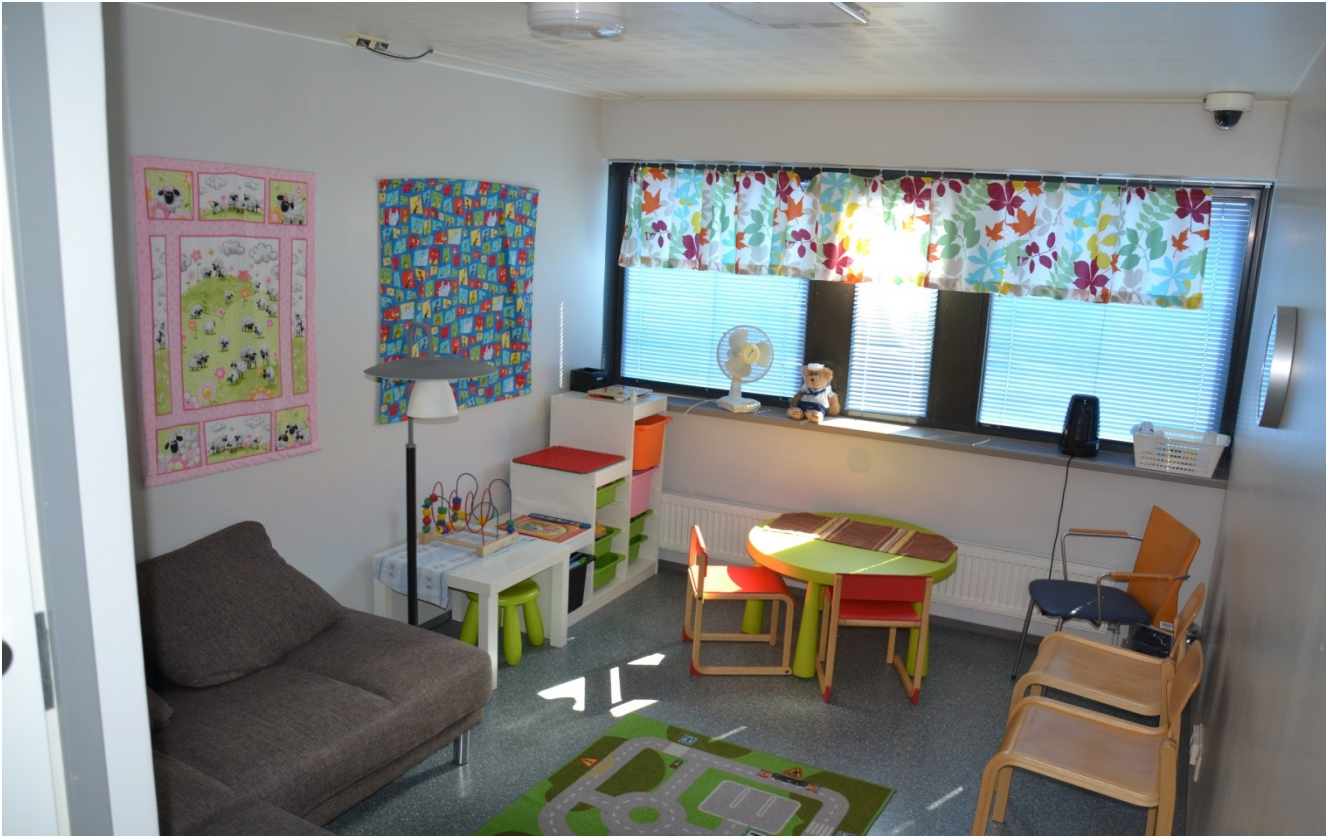
KUVA 5. Lapsitapaamistila

Tila, jossa lapsitapaamiset järjestetään, on sisustettu lapsille sopivaksi. Tilasta löytyy pelejä, kirjoja ja leluja. Tilassa on kameravalvonta. Vanki varaa tapaamisen osastolta saatavalla hakemuksella. Sen jälkeen hän ilmoittaa tapaamisen ajankohdan tapaajille. Vangille ei voi tuoda mitään tapaamiseen eikä vanki voi myöskään antaa tapaajille mitään tapaamisen yhteydessä. Lapsitapaamisia on mahdollista saada noin neljän viikon välein varaustilanteen mukaan.