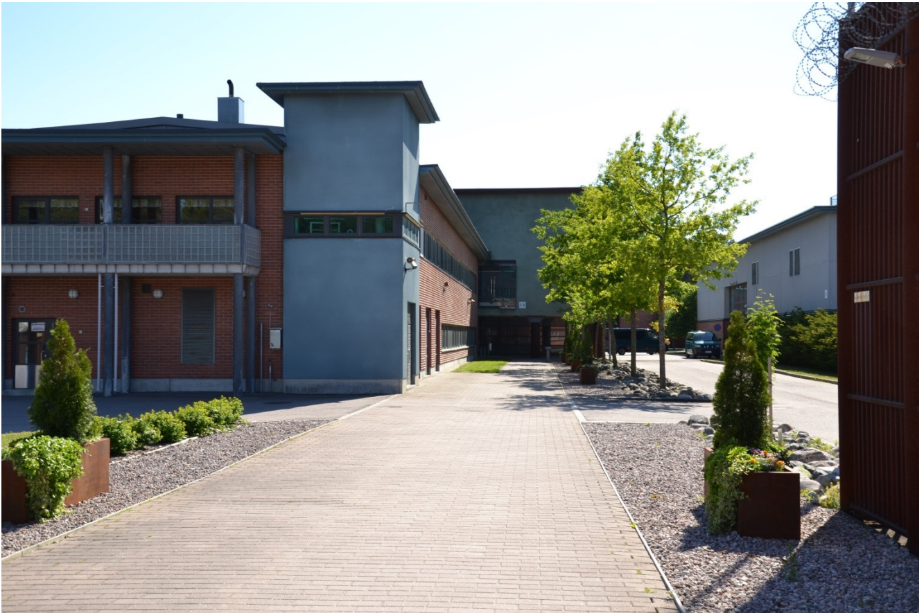
KUVA 2. Kulku portilta vankilalle

785K. Tikkurilasta tulevista busseista 712 tuo ilman vaihtoja lyhyen kävelymatkan päähän vankilasta.