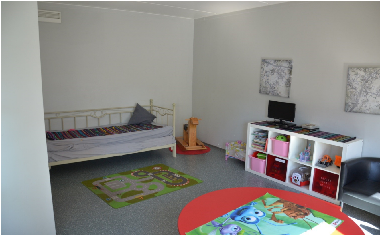
KUVA 6. Perhetapaamistila