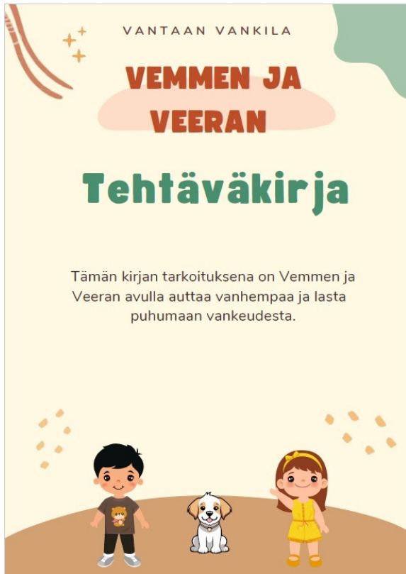
KUVA 12. Vemmen ja Veeran tehtäväkirja

https://www.rikosseuraamus.fi/fi/index/toimipaikatjayhteystiedot/vankilat/vantaanvankila.html