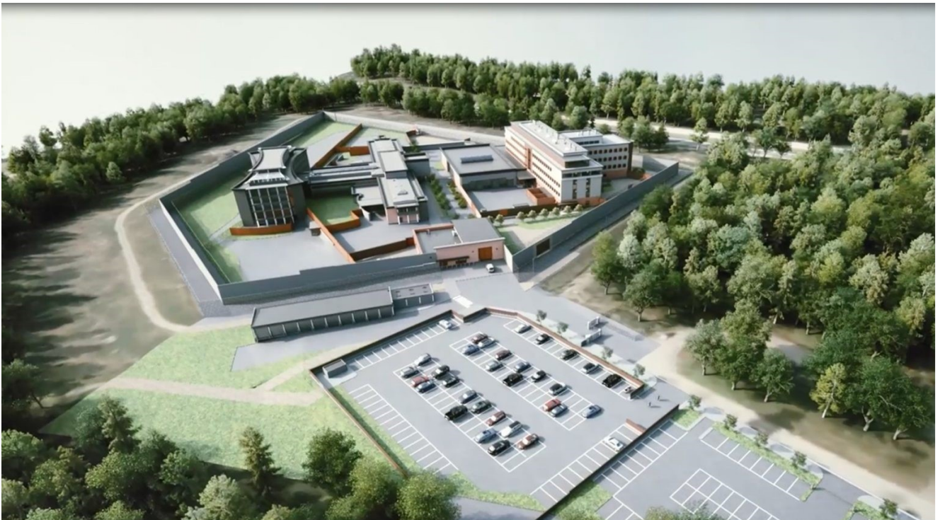
KUVA 1. Vantaan vankila

Tutkintavankeuden alkuvaiheeseen liittyy paljon käytännön kysymyksiä, eikä yhteydenpito läheiseen ole aina helppoa. Toivomme, että opas antaa vastauksia vankilakäytäntöjä koskeviin kysymyksiin ja helpottaa kuormittavuutta uudessa elämäntilanteessa.