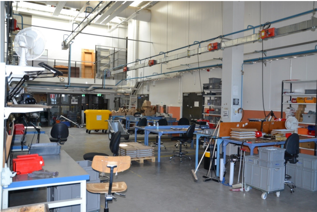
KUVA 8. Vankilan työliike

Vantaan vankilan työliikkeellä on kolme eri osastoa: kokoonpano- ja pakkaus-, puutyö- sekä metalliosasto. Kokoonpano-osastolla kootaan erilaisia sähkötuotteiden komponentteja ja pakataan ruuveja. Puutyöosastolla valmistetaan erilaisia kalusteita ja suoritetaan kunnostus-, korjaus- sekä maalaustöitä. Metallityöt vaativat aiempaa alan kokemusta, muut työt huolellisuutta ja kädentaitoja. Työliikkeen lisäksi jokaisella vankiosastolla on oma putsaajavanki huolehtimassa osaston siisteydestä. Myös vankilan pyykkihuollossa työskentelee muutamia vankeja.