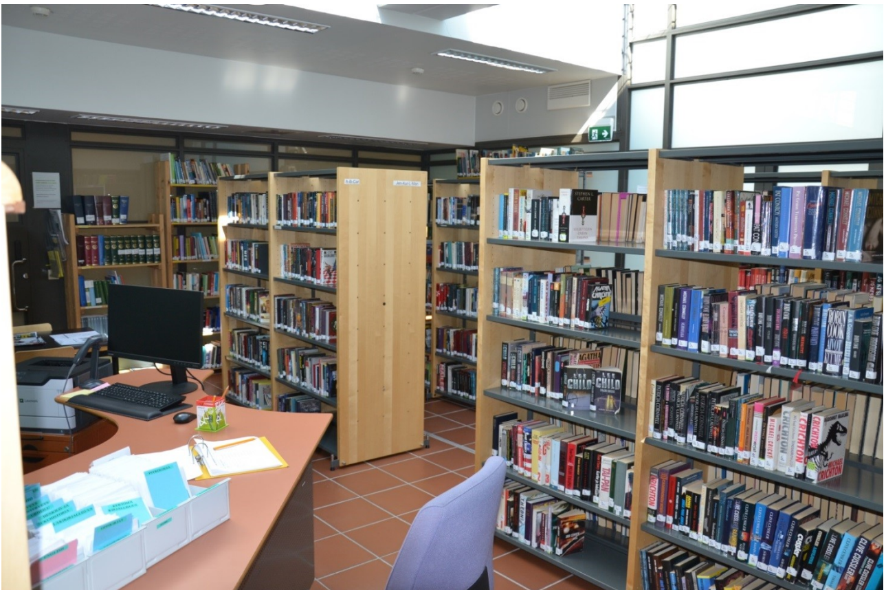
KUVA 7. Vankilan kirjasto