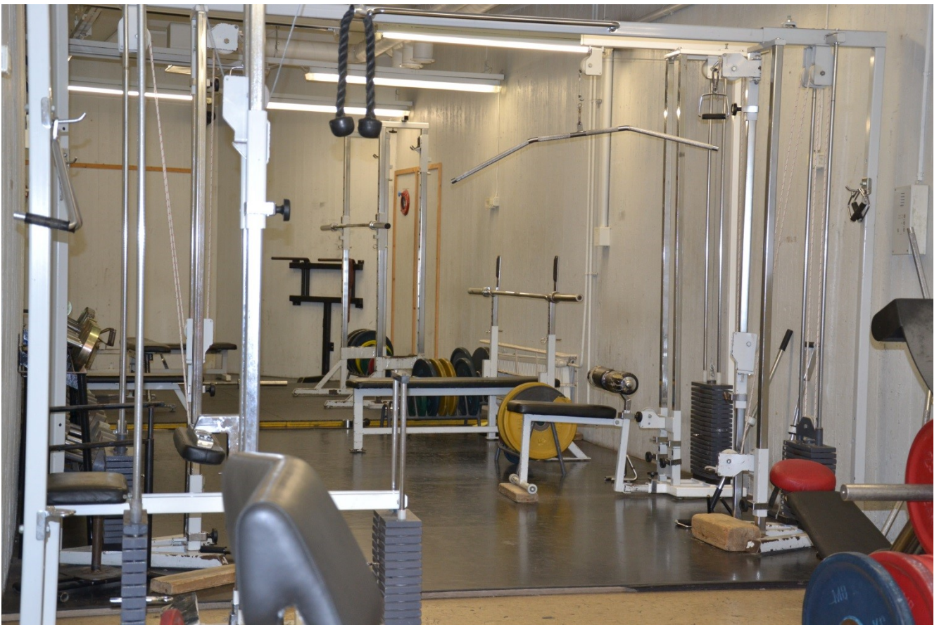
KUVA 9. Vankien punttisali

Vangeilla on päivittäin mahdollisuus ulkoilla tunti osaston päiväjärjestyksen mukaisesti. Suljettujen osastojen vangeilla on mahdollisuus käyttää osaston kuntoiluhuonetta. Avoimien osastojen vangit pääsevät halutessaan viikoittain liikuntahalliin sekä punttisalille.