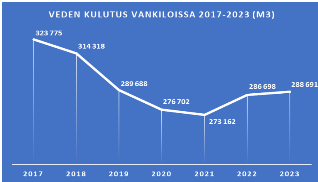
Kuva 7. Vedenkulutus vankiloissa vv. 2017–2023 (m 3 )

Peilattaessa kulutuksia vertailuvuoteensa (2019) voidaan selkeästi nähdä, että Rikosseuraamuslaitos on omilla toimillaan saanut jalanjälkeään pienennettyä hyvin. Lämmön kulutus on pienentynyt vertailuvuodesta noin 12 % ja sähkönkulutus yli 7 %. Tulevaisuuden haasteena on lisätä vangeille suunnattua viestintää vastuullisesta kuluttamisesta. Vangit vaikuttavat suuresti esimerkiksi käyttämänsä veden määrään ja kulutus näiltä osin onkin pysynyt lähestulkoon vertailuvuoden tasolla.