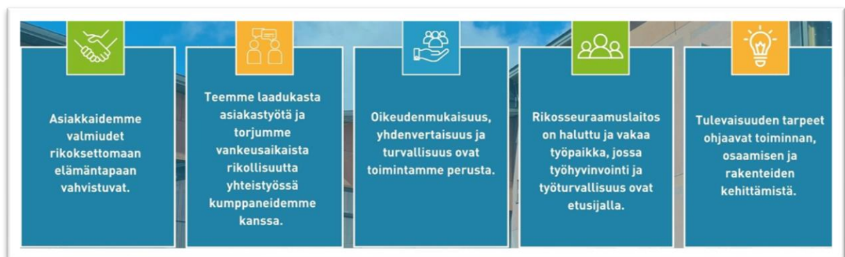
Kuva 2. Rikosseuraamuslaitos – Strategiset tavoitteemme 2024–2027

Rikosseuraamuslaitos on vuonna 2023 laatinut toiminnalleen uudet strategiset tavoitteet ja vision vuosille 2024–2027. Uusi strategia on julkistettu syksyllä 2023. Strategiatavoitteissa näkyy erityisesti Rikosseuraamuslaitoksen rooli sosiaalisten vastuiden osalta;