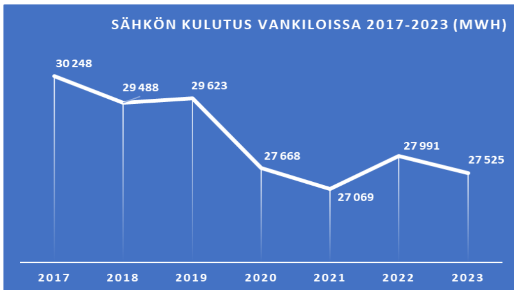
Kuva 6. Sähkön kulutus vankiloissa vv. 2017–2023 (MWh)