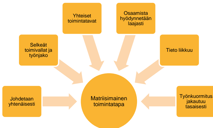
Kuva 3. Matriisimainen toimintatapa Rikosseuraamuslaitoksessa.

Matriisimaista toimintatapaa on edistetty perustamalla matriisiryhmiä huolehtimaan ja kehittämään organisaation eri ydinprosesseista ja tietyistä tehtävistä. Matriisiryhmät keskittyvät muun muassa tulos- ja toiminnanohjauksen, kansainvälisen toiminnan, työhyvinvoinnin, sidosryhmäyhteistyön, viestinnän, laatutyön, varautumisen ja vaikuttavien palveluiden prosessien kehittämiseen.